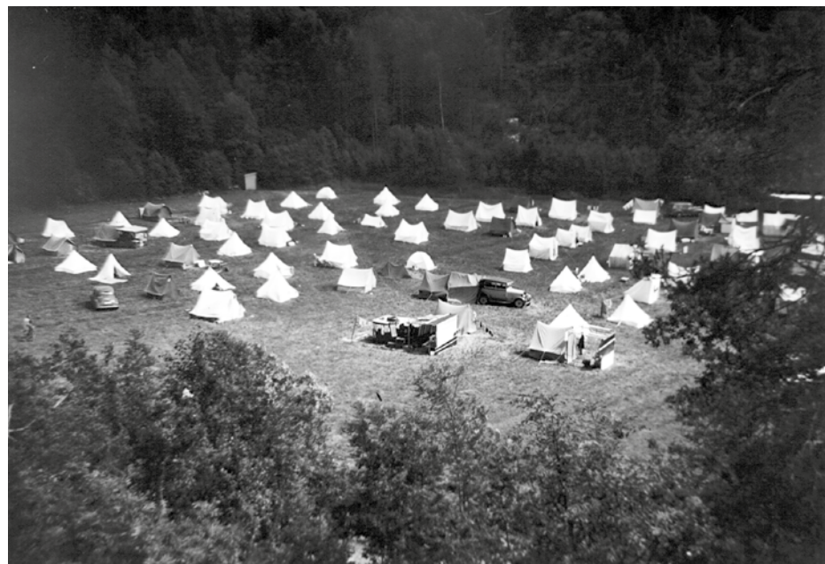
Det begynte som en teltplass. BCC har lange tradisjoner på Oslofjord