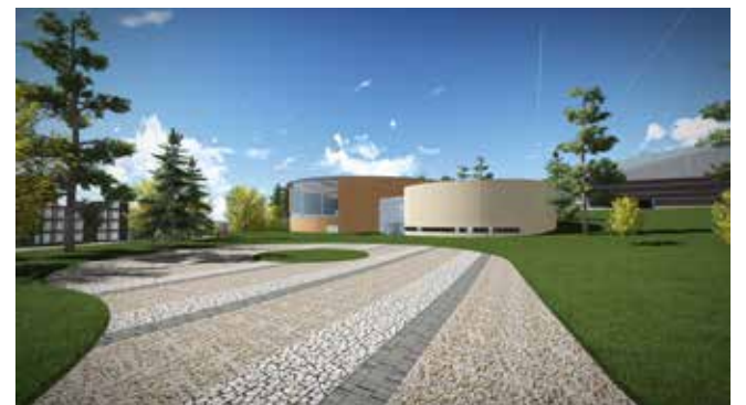
Skisse for bade- og treningsanlegg, med flerbrukshallen i bakgrunnen.