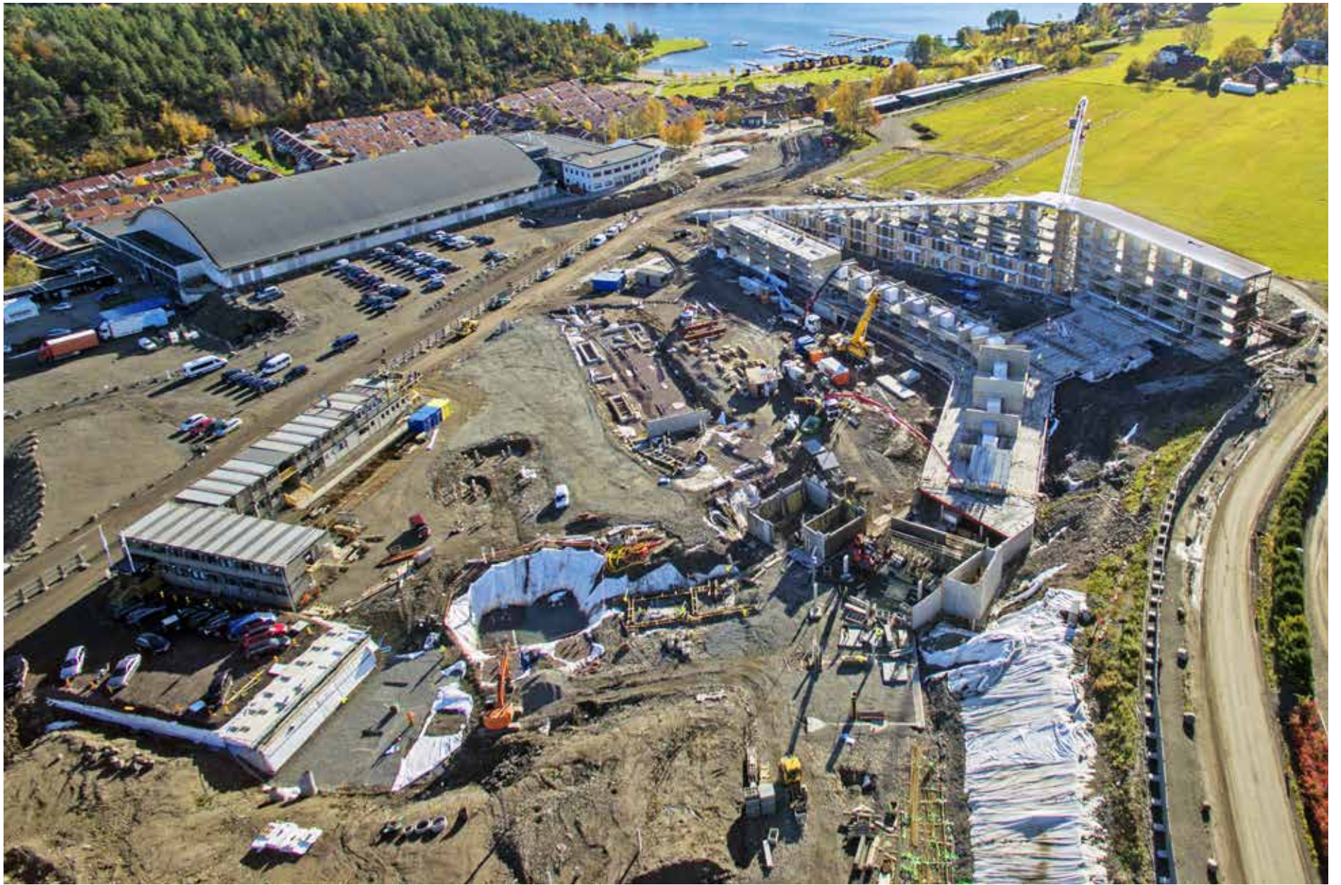
Slik ser byggeplassen for de nye hotellbyggene på Oslofjord ut.