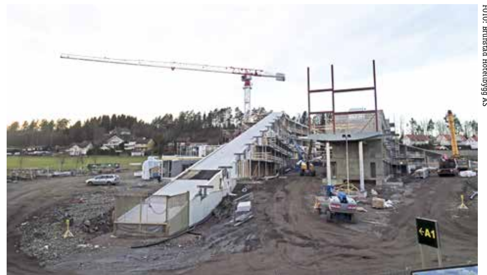
De nye hotellbyggene tar fort form når byggingen først er i gang.