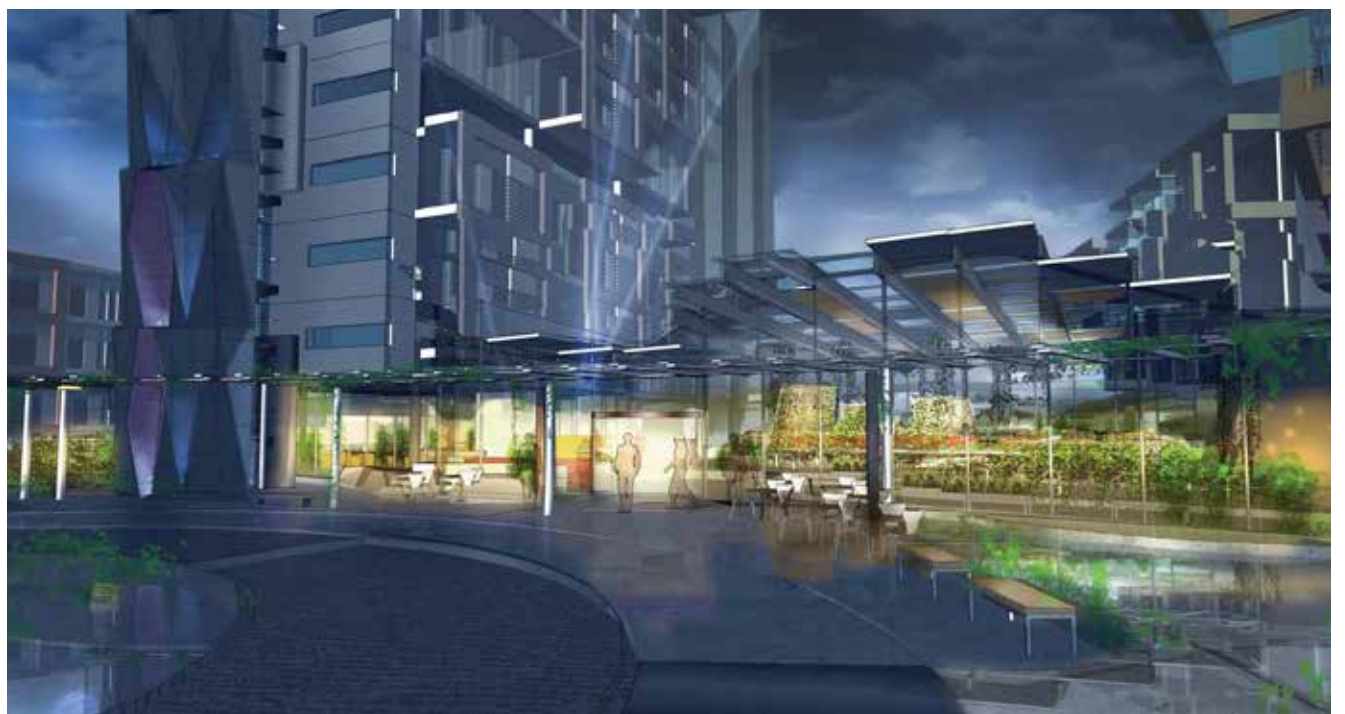
Skisse for hotellbyggene nærmest aktivitetsanlegget