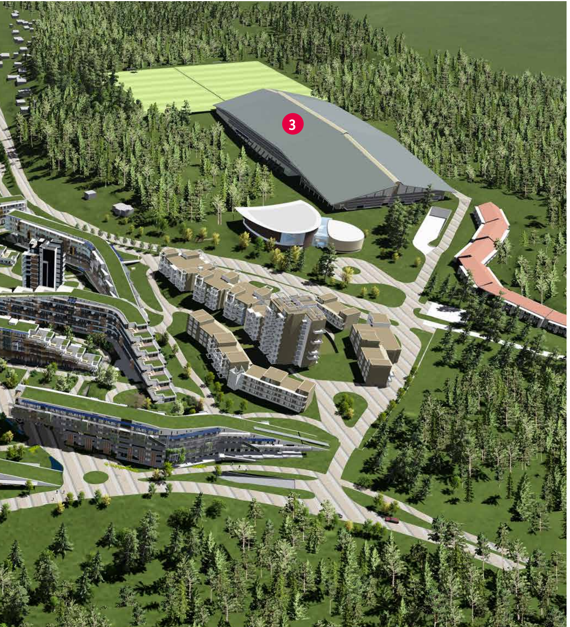
Skisse fra arkitekt Niels Torp as. Ikke alle deler av anlegget er ferdig prosjektert, og endringer kan forekomme.