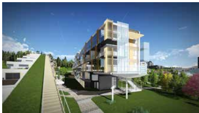
Arkitektskisser for de nye hotellbyggene.