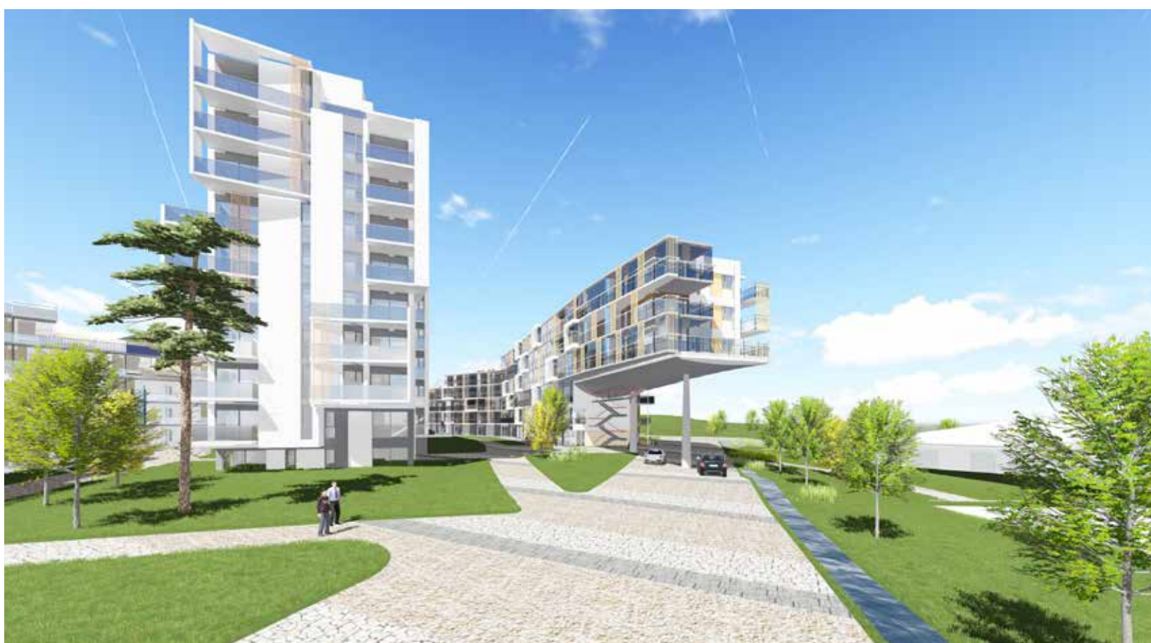
Skisse fra arkitekt Niels Torp AS.

Hvilke forventninger har dere og barna ellers til hotellkonseptet?